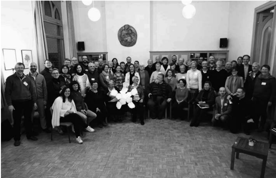
De delegaties van de Europese GCL-gemeenschappen bij elkaar in Hautmont